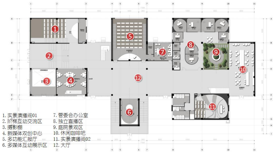
图4 容艺影视产业学院实训基地