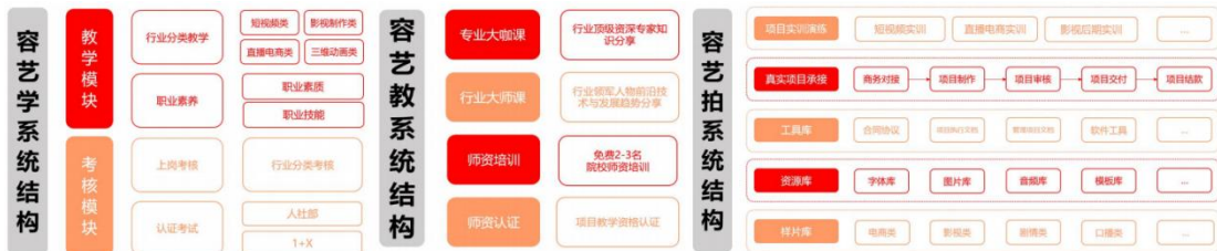
图5 短视频实训系统

短视频工厂，作为全媒体产教融合示范基地组成部分之一，兼顾教学场景和生产制作需求，同时可进行独立运营。短视频工厂包含容艺云平台、云制作系统、融媒体系统、虚拟演播系统等模块。学院依托短视频工厂，构建起校内短视频制作产业链，从市场订单分发、项目接包制作、项目提交结算到数字文创人才实训实战全覆盖。通过引产入校，以产促教，大幅提升高校产业运营与社会服务能力，在培养紧贴行业需求的新型数字文创人才的同时，持续获得市场化项目收益。